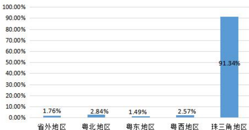
图 1-2 2019 届毕业生就业地区分布

学院 2019 届毕业生已就业人数为 739 人。其中，在省外地区就业的有 13 人，占已就业人数的 1.76%；在珠三角地区就业（含广州、深圳、佛山、肇庆、惠州、珠海、江门、东莞、中山共 9 个城市）的人数有 675 人，占已就业人数的 91.34%；粤北地区就业的人数有 21 人，占已就业人数的 2.84%；粤东地区就业的人数有 11 人，占已就业人数的 1.49%；粤西地区就业的人数有 19 人，占已就业人数的 2.57%。2019 届毕业生的主要就业地区是珠三角地区。